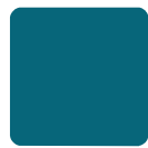
BLU PETROLIO SATINATO*