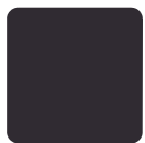
NERO SMOCKY OAPCO*