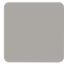
GRIGIO LOFT SATINATO